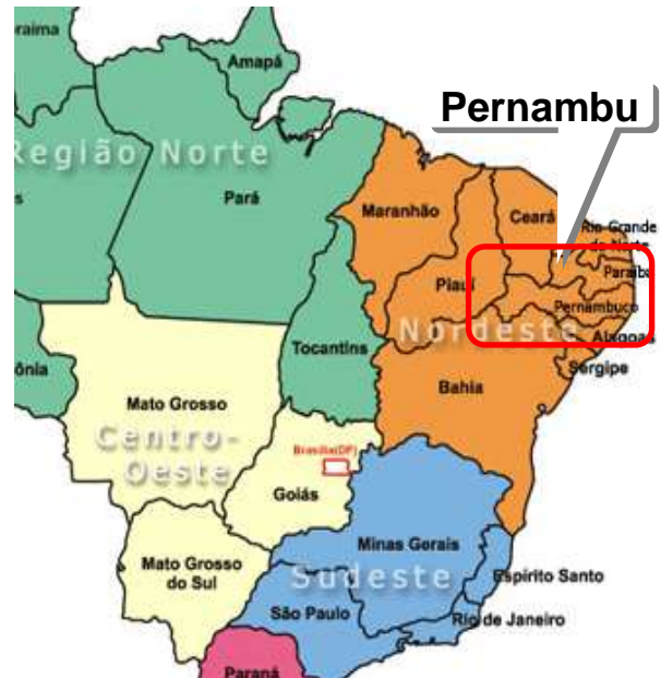
Figuur 1: Pernambuco (98.312 km 2 ) is een van de armste staten van Brazilië in het ruige Noordoosten.

Activiteit Uitvoerende instantie Fondswerving , organisatie, administratie en rapportage - SKIBRA (Nederland) Projectleiding en uitvoering, rapportage aan SKIBRA - COSKIBRA Onderwijs aan ongeveer 80 kinderen (3-6 jaar) - ESCOLA DOS ANJOS Activiteiten m.b.t. legalisering en regelgeving - COSKIBRA Voedselhulp , kerstpakketten en waterdistributie platteland - COSKIBRA