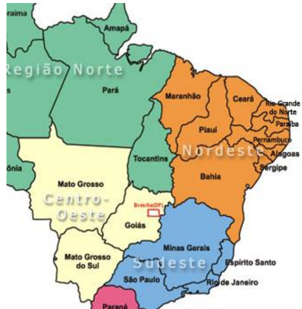
Figuur 1: Pernambuco (98.312 km 2 ) is een van de armste staten van Brazilië in het ruige Noordoosten.

Uitvoerende instantie - SKIBRA (Nederland) - COSKIBRA - ESCOLA DOS ANJOS - COSKIBRA - COSKIBRA