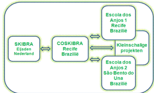
Figuur 2: Relatie tussen de vrijwilligersorganisaties SKIBRA in Nederland en COSKIBRA/Escola dos Anjos in Brazilië.