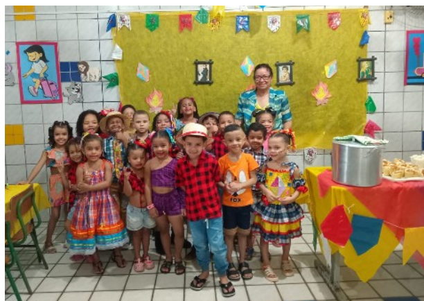
Afb. 6: São João betekent ook een klein feestje op school, met popcorn, cake en limonade

Doordat er vaker mensen thuis overvallen worden, waarbij soms het hele huisraad wordt gestolen, is de angst onder de bewoners groot. Zo ook bij onze juffen, die eerst goed om zich heen kijken voordat ze de schooldeur open doen om naar binnen te gaan. In 2025 zijn er gelukkig geen verdere bedreigingen aan het adres van de school geweest. Toch durven de juffen nog steeds niet met de kinderen door de straten van San Martin te defileren, zoals gebruikelijk was op de Onafhankelijkheidsdag.