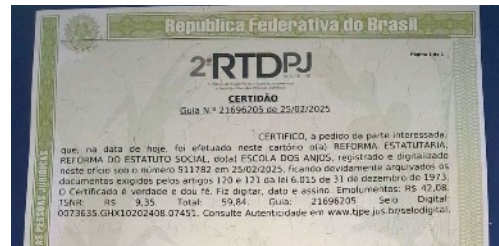
Afb. 3: De akte van registratie van het aangepaste statuut.

De verkiezing was nodig omdat het mandaat van het zittende bestuur op 5 januari zou aflopen. Aangezien er in het verleden gekozen was om het bestuur van de COSKIBRA ook het bestuur van de Escola dos Anjos was, moest hiervoor het statuut van de Escola dos Anjos aangepast en bij de notaris geregistreerd worden. Vanaf 2025 heeft de Escola dos Anjos dus een eigen bestuur.