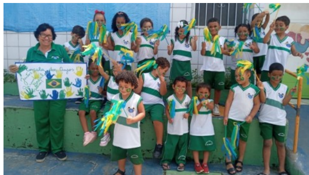
Afb. 7: Onafhankelijkheidsdag op de stoep...