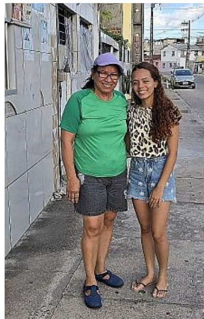
Afb. 9: Een onverwachte ontmoeting, met een mooi verhaal!

Een andere ex-leerling sprak ons aan in de MAKRO supermarkt, tegenwoordig de ATACADÃO genaamd. Hij heeft daar een mooie baan gekregen en ook hij herinnert zich de leuke tijd op de Escola dos Anjos. Wat worden die kleine kindertjes groot! Sommigen herken je niet eens meer! Gelukkig zijn zij hun Tia van destijds niet vergeten!