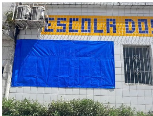
Afb. 5: Het blauwe zeil met UV filter houdt veel zonnehitte tegen, zodat de kinderen en de juffen niet smelten in de klas....

In de schoolvakanties in januari en juni nemen we de gelegenheid te baat om noodzakelijk onderhoud te doen aan gebouw en inrichting. Zo hebben we in januari 2025 het groot onderhoud aan de airco laten doen en tegelijk ook een nieuw zonwerend zeildoek voor de ruiten gespannen, om zoveel mogelijk zonnehitte buiten te houden. Vooral in de zomermaanden december tot april kan de zon erg heet zijn. Beide maatregelen hebben een stevig verkoelend effect, zodat het in de klassen niet warmer wordt dan 27 à 28 graden. Voor onze begrippen in Nederland nog steeds erg warm!