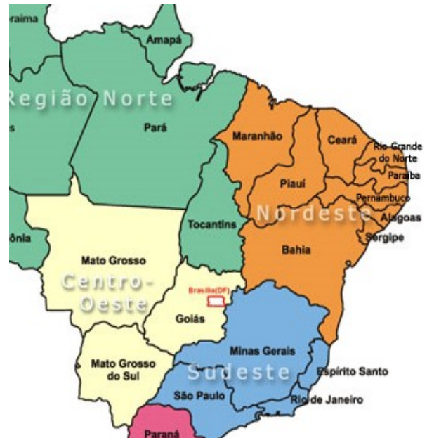
Afb. 1: Pernambuco is een van de armste staten van Brazilië in het ruige Noordoosten.

Uitvoerende instantie - SKIBRA (Nederland) - SKIBRA - ESCOLA DOS ANJOS - SKIBRA via ESCOLA DOS ANJOS - SKIBRA via ESCOLA DOS ANJOS