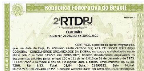
Afb. 4: Akte van registratie van de opheffing van COSKIBRA

Het hele proces, dus ook de stappen volgend op dit besluit was uitgestippeld met behulp van AI (ChatGPT) dat - in het Portugees- een complete beschrijving van benodigde acties maakte, inclusief modellen van officiële aktes in het Portugees en brieven aan de gemeente Recife en de federale belastingdienst, alles conform de vereisten in het Burgerlijk Wetboek van Brazilië. Onze bevriende advocaat (Gilberto) bekeek het plan en gaf aan dat het helemaal klopte. Dat het proces nog tot juni 2025 in beslag nam kwam door obstructies van het notariskantoor waar de Opheffingsakte geregistreerd moest worden. Het kostte heel wat heen en weer gereis naar dat kantoor, maar dankzij stille interventie van Gilberto werd het verzet van de 'juristen' van het notariskantoor uiteindelijk opgegeven. We konden zegevierend het strijdtoneel verlaten, met de geregistreerde opheffingsakte in de hand! Het opheffen van deze vereniging had enorm veel tijd gekost gedurende de vakantieperiode van de school.