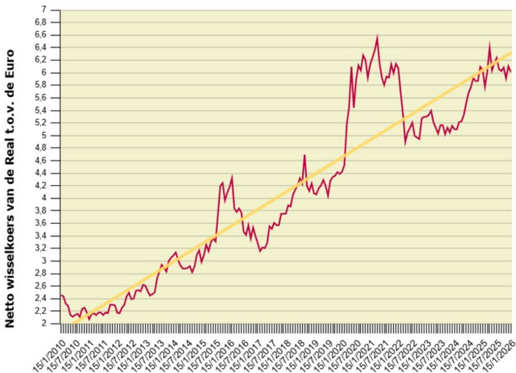
Afb. 10: Het verloop van de wisselkoers voor de Real. Na 25 jaar registratie is het goed mogelijk om de koerstrend (gele lijn) door te trekken naar de toekomst.

Bijgaande grafiek toont het verloop van de netto wisselkoers per maand sinds 2010 gemeten op dag 15 van elke maand (Bron: OANDA.com). Als netto wisselkoers hanteren we de officiële interbancaire koers minus 4%. Dat zijn bij benadering de kosten die de wisselkantoren inhouden.